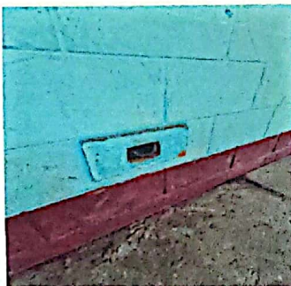
Foto 5: conexiones de tomacorrientes sin placas y tapaderas modulos I, II Y III