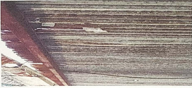
Foto 1: laminas del modulo III en mal estado con agujeros por oxidación