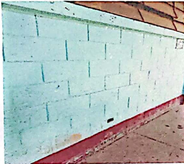
Foto 3: paredes en mal estado con pintura deteriorada y sin tomacorrientes modulos I, II Y III