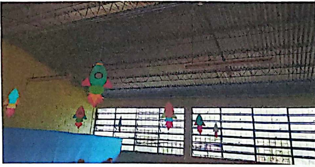
Foto 1: tendaido electrico dentro de las aulas en mal estado sin plafoneras