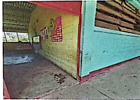
Foto 4: paredes sucias con pintura deteriorada en mal estado modulos I, II Y II