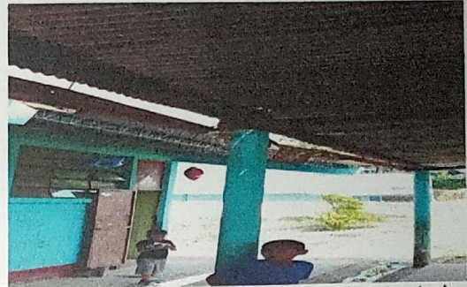
Foto 2: Laminas en mal estado ya deterioradas a punto de colapsar modulo III