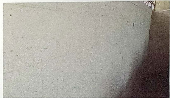
Foto 4: Paredes de las aulas interior y exterior en mal estado modulos I Y II