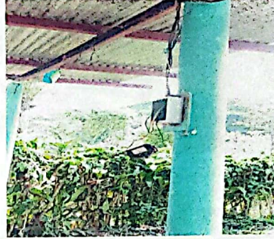
Foto 2: cajas de registro en mal estado sin flipones en los distintos modulos