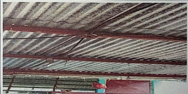
Foto 6: tendido electrico en mal estado sin plafoneras modulo III

Observación: Si es necesario se pueden agregar hojas adicionales y actualizar el número de hojas.